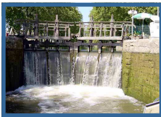
Scolaires et tout public