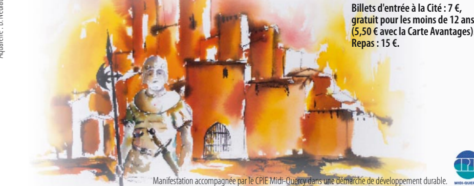
Manifestation accompagnée par le CPIE Midi-Quercy dans une démarche de développement durable.

18h30 : Totes à la glèsià! Choeurs médiévaux dans la collégiale Saint-Martin.