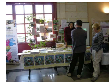
Stand du CPIE Midi-Quercy

CC QRGA, poursuit ainsi l'objectif de faire découvrir l'environnement aux jeunes tout en leur permettant un accès facilité au sport et à la culture.