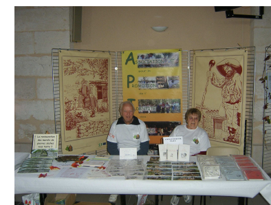
Stand de l'APICQ

Et ces projets sont nombreux en Midi-Quercy.