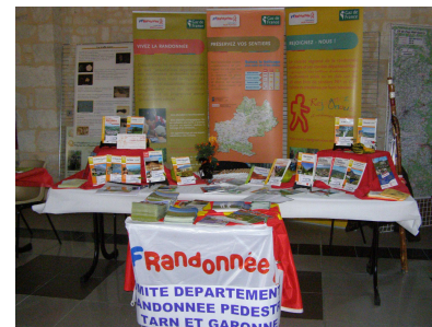
Stand du CDRP 82

De la formation fédérale, aux méthodes d'entretien des sentiers en passant par l'organisation du balisage, les actions assurant la sécurité et le bien être des pratiquants étaient représentées sur le stand du comité départemental mais aussi à travers ceux des communautés de communes qui oeuvrent pour cela au quotidien.