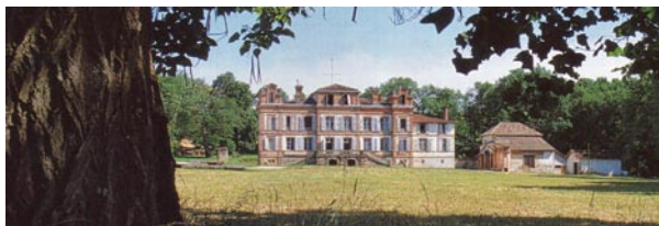
Le Château de Pousiniès, à l'entrée du Domaine de Pousiniès