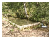
Le lavoir d'Embarre

Une balade facile à travers des paysages boisés et champêtres qui permet de découvrir le village médiéval de Montricoux et les prémices du causse. A noter quelques passages goudronnés.