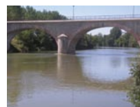
Pont de Bioule sur l'Aveyron