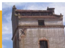
Pigeonnier en forme pied de mulet

Depuis la seconde moitié du XVI e siècle, la partie centrale et orientale de la commune était occupée par les catholiques tandis que la partie occidentale de la commune, autour du hameau « La Bouffière » était protestante. L'école protestante fut construite au cœur de ce hameau au XIX ème siècle.