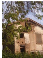
Maison du pêcheur

Le pont de Bioule a été construit en 1859 remplaçant ainsi le bac qui permettait de franchir l'Aveyron et de relier Bioule à Nègrepelisse. En rive droite de l'Aveyron et en amont du pont, une ancienne maison du pêcheur en terre crue témoigne d'un passé de pêche professionnelle sur la rivière.