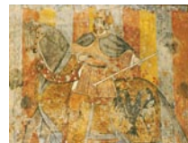
Peintures murales ornant la salle des Chevaliers

Le Château abrite aujourd'hui l'école du village et se visite durant l'été.