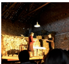
Les maisons natales - Grange de Mme Teulières