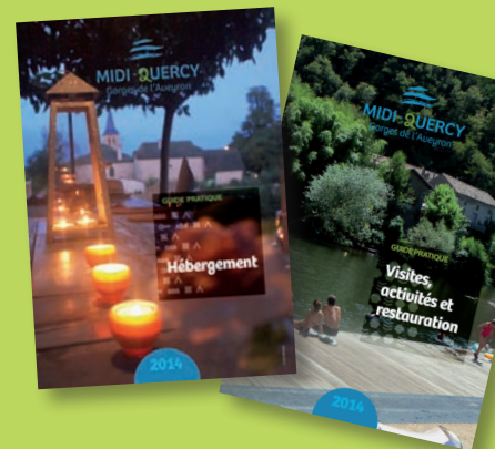
Guides pratiques hébergement et activités restauration 2014

Marque : Midi-Quercy, gorges de l'Aveyron