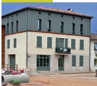
La Maison de l'Emploi Midi-Quercy