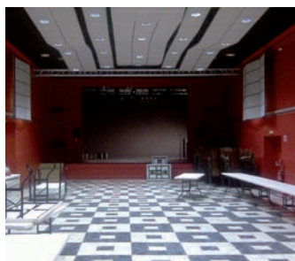
Aménagement de la salle des fêtes en salle de spectacle à St Antonin Noble Val