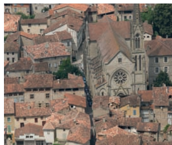
L'aménagement de 2 Offices de Tourisme Saint Antonin Noble Val et Caussade