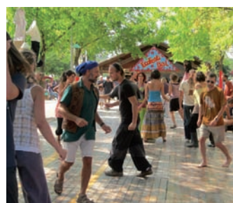
EcoFesti'Bal proposé par l'association CITRUS