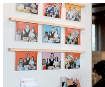
les programmations du centre d'art et de design la cuisine ;