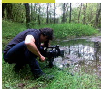
Place de la Halle : Web TV