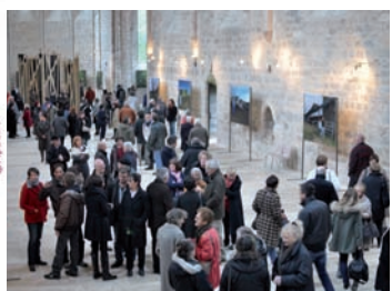
Exposition « gens de la terre » - Abbaye de Beaulieu