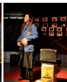
Le temps des paysans - Chapiteau du Babel Gum

Au regard de l'expérience avérée du GAL vis-à-vis des programmes européens, une coopération transnationale serait un objectif à inscrire dans la prochaine programmation du Leader.