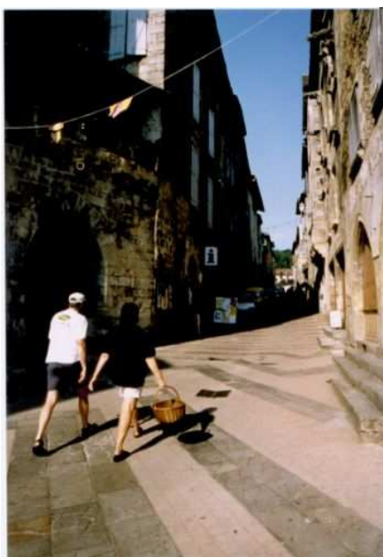
La Rue Droite