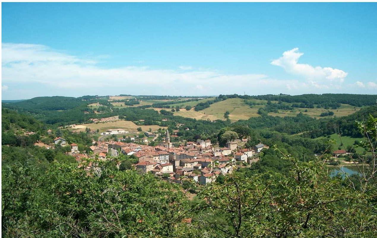
Bourg-centre de Caylus