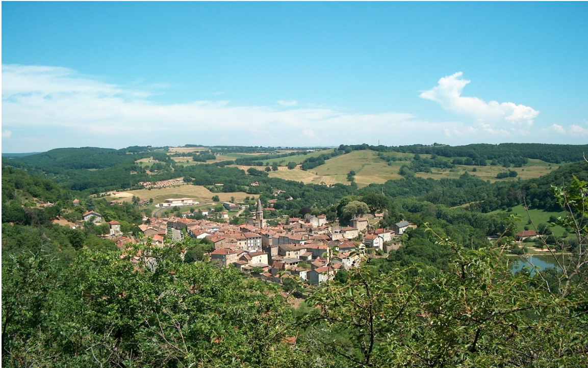
Bourg-centre de Caylus