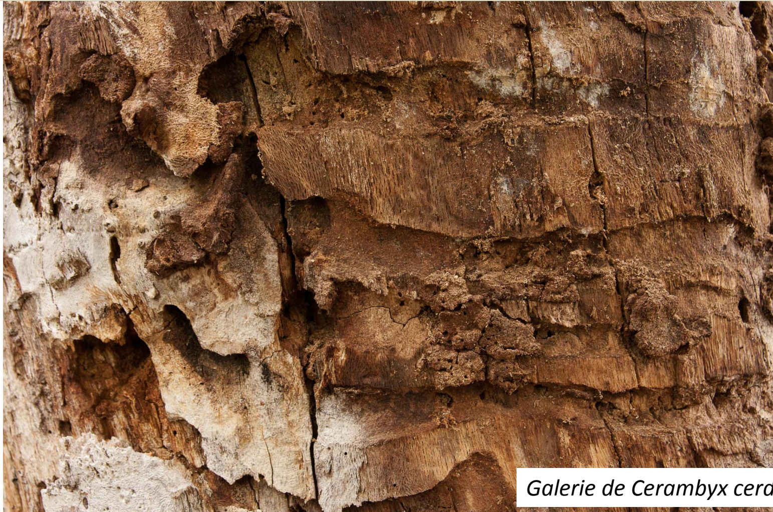
Galerie de Cerambyx cerdo