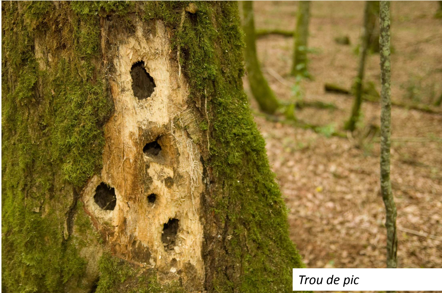
Trou de pic