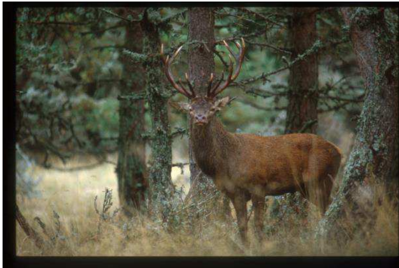
Ongulés (ex: Cerf )