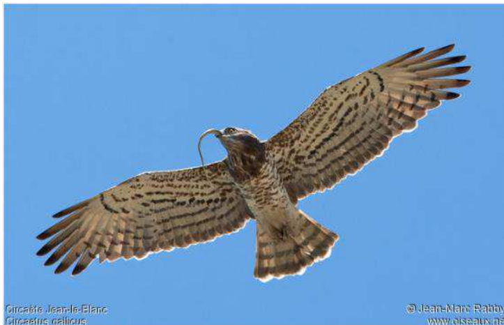
Circaète Jean-le-Blanc Circaetus galicus