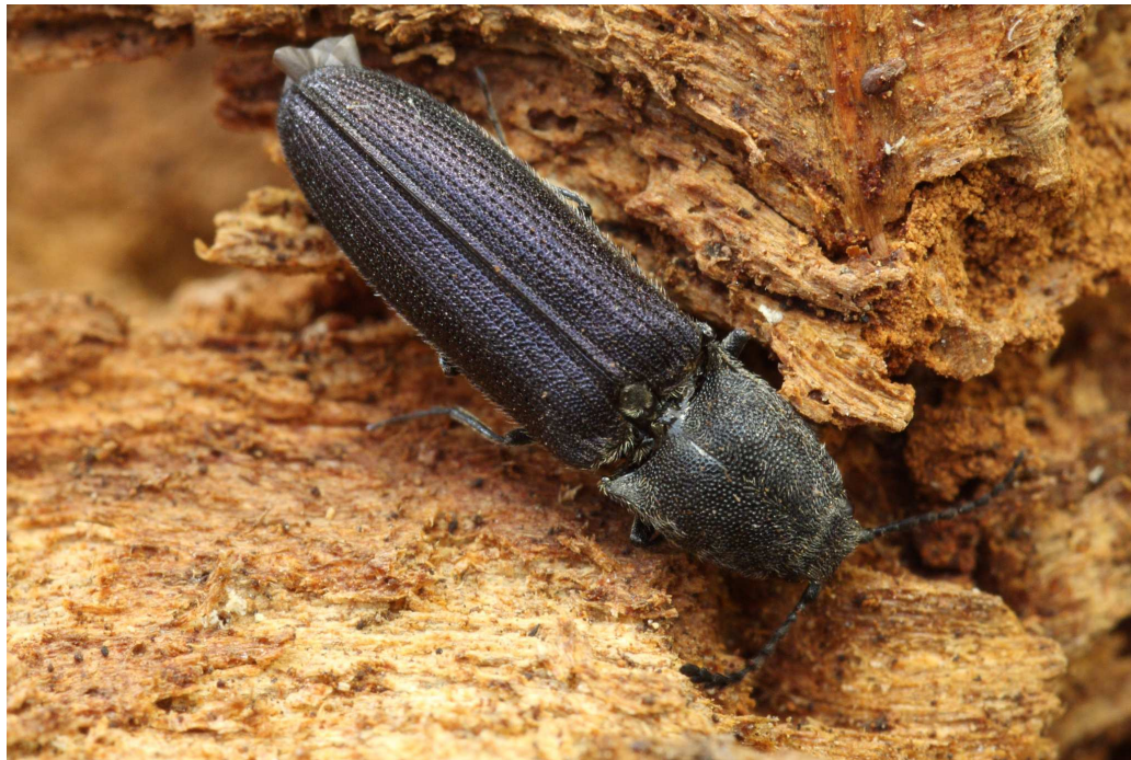
Limoniscus violaceus (Taupin violacé)