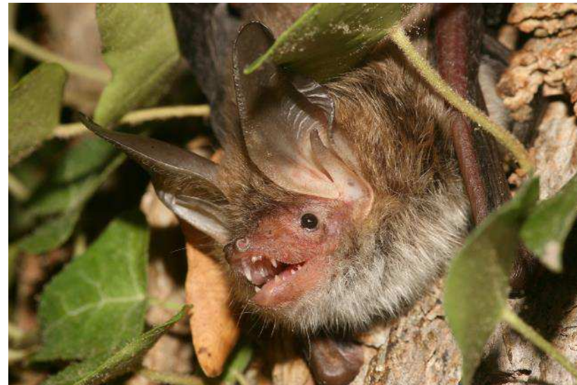
Chauves souris (ex: Murin de beschtein)