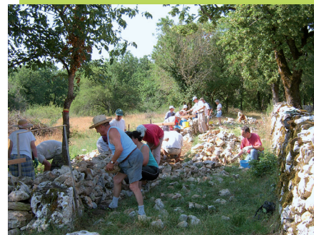
Reconstruction de murets à Puylaroque (Somplessac) par l'APICQ