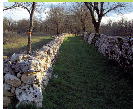
A Somplessac, 285 mètres linéaires de murets en pierre sèche ont été reconstruits, ainsi qu'une gariotte