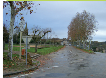
A Montricoux, avant travaux