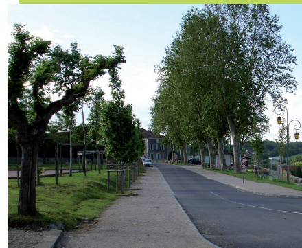
A Montricoux, après travaux