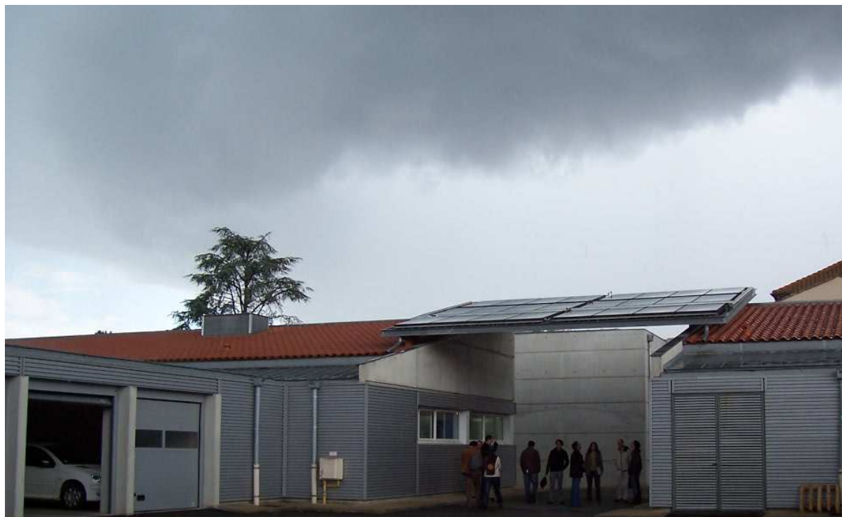
VISITE PLUVIEUSE DE L'INSTALLATION SOLAIRE THERMIQUE DE L'HOPITAL LOCAL DE NEGREPELISSE - LE 6 JUIN