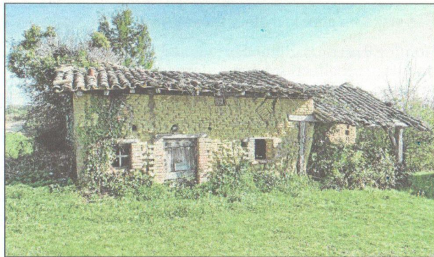
Vieille maison en terre de chez nous

Mercredi dernier, la terre et le savoir-faire lié à son utilisation dans l'architecture d'hier et d'aujourd'hui étaient doublement à l'honneur dans le département et plus particulièrement dans le moliérain, d'une part avec la visite de stagiaires missionnés, dans le cadre d'une formation nationale, par le ministère de la culture et, d'autre part, avec la présentation d'un ouvrage consacré