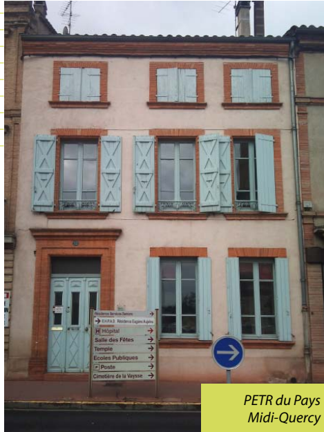
PETR du Pays Midi-Quercy

PETR du Pays Midi-Quercy 12 rue Marcelin Viguié 82800 Négrepelisse Tél. : 05 63 24 60 64 Mail : pays.midi.quercy@info82.com